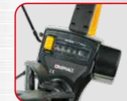
Leva di reset dei contatori

Campo di misura: 10 km Precisione di misurazione: 10 cm