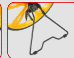
Staffa laterale di parcheggio