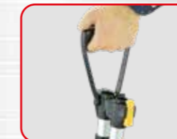
Maniglia di trasporto