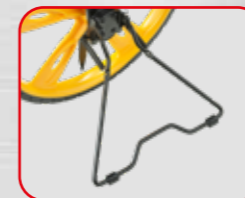
Support de parking latéral