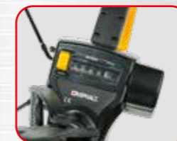
Levier de remise à zéro

Mesurage: 10 km Précision de la mesure: 10 cm